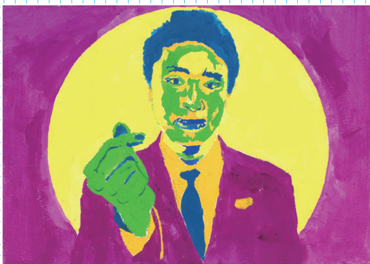
目黒区立第八中学校の生徒作品

令和6年 (2024年) 1月20日 土 → 2月4日 日 10:00～18:00 (ただし入館は17:30まで)